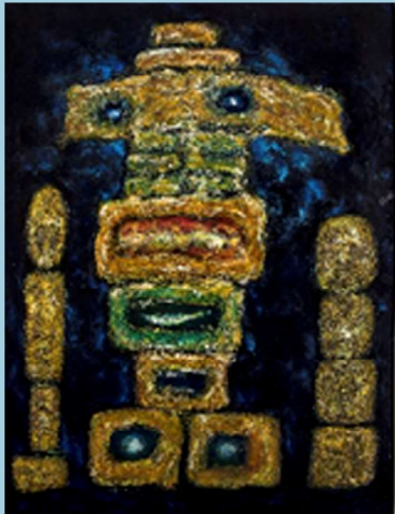
Amon en de Obelisk