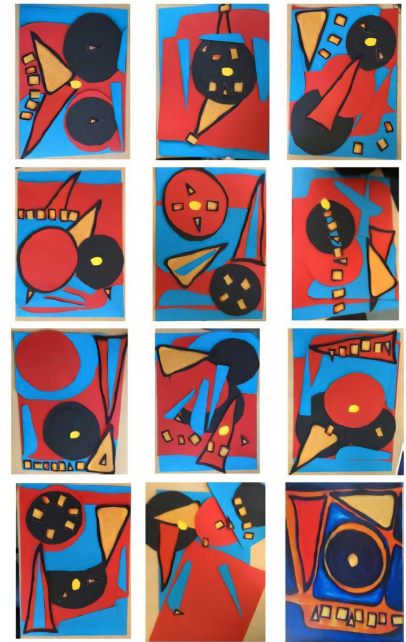
Resultaten van de leerkrachten in opleiding. Rechtsonder het originele werk van Kor Rond-point pourpre